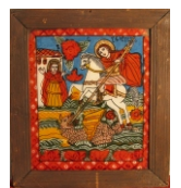
Tema: Sfântul Mucenic Gheorghe Școala: Șcheii Brașovului Datare: sf. sec. XIX înc. sec. XX