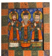
Tema: Sfinții Trei Ierarhi Școala: Laz sau Lancrăm Datare: a doua jumătate a sec. XIX