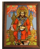
Tema: Iisus Hristos Pantocrator Școala: Făgăraș. Ioan Pop Datare: 1861