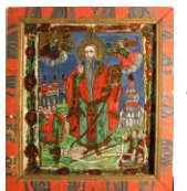
Tema: Sfântul Haralambie Școala: Mărginimea Sibiului. Săliște Datare: sec. XIX