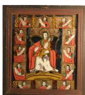
Tema: Maica Domnului Împărătiță, cu Apostolii Școala: Nicula Datare: sf. sec. XIX = înc. sec. XX