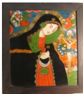
Tema: Maica Domnului Îndurerată Școala: atelier din Țara Oltului Datare: a doua jumătate a sec. XIX sau înc. sec. XX