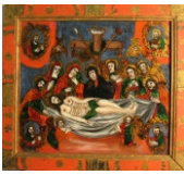
Tema: Prohodul Domnului Școala: Mărginimea Sibiului. Săliște Datare: sec. XIX