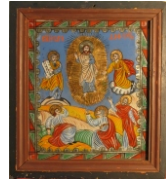
Tema: Schimbarea la Față Școala: Făgăraș Datare: sec. XIX