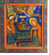
Tema: Buna Vestire Școala: Laz Datare: sec. XIX