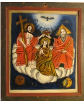
Tema: Încoronarea Fecioarei Școala: Laz. Probabil Pavel Zamfir Datare: 1856