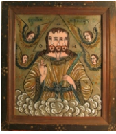
Tema: Sfânta Treime/ Întreita Față Școala: Laz sau Lancrăm Datare: mijlocul sec. XIX