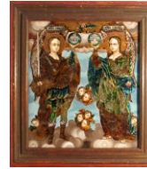
Tema: Sfinții Arh. Mihail și Gavriil Școala: Mărginimea Sibiului. Săliște. Pictor: probabil Ion Morar Datare: a doua jumătate a sec. XIX