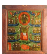
Tema: Judecata de Apoi Școala: Laz Datare: sf. sec. XIX