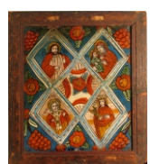
Tema: Masa Raiului Școala: Șcheii Brașovului Datare: sec. XIX