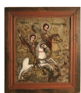
Tema: Sf. Gheorghe și Teodor Tiron Școala: Laz sau Lancrăm Datare: prima jumătate a sec. XIX