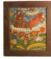
Tema: Sfântul Ilie Școala: Șcheii Brașovului Datare: sec. XIX