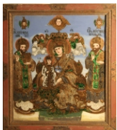
Tema: Maica Domnului cu Ierarhi Școala: Mărginimea Sibiului. Săliște Datare: sec. XIX